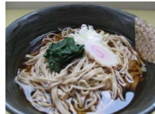
かけうどん かけそば 550円