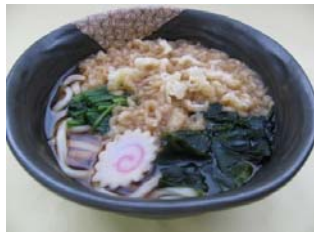
たぬきうどん たぬきそば 580円