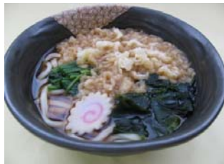
たぬきうどん たぬきそば 580円