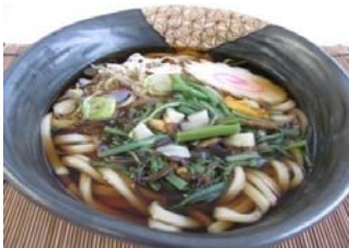
山菜うどん 山菜そば 600円