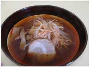
ピリ辛 ラーメン 730円