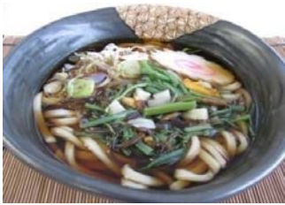
山菜うどん 山菜そば 600円