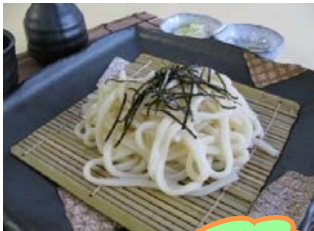
ざるうどん ざるそば 550円